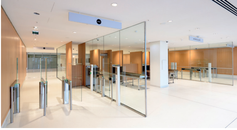
Tribunal de Paris Portiques d'accès