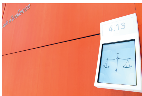
Tribunal de Paris Salle d'audience signalétique