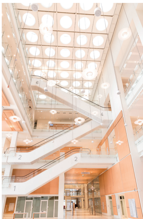
Tribunal de Paris Salle des pas perdus

Le bâtiment, ancré dans un éco quartier en pleine transformation, et tourné vers la qualité de vie de ses occupants et les usages innovants en matière de développement durable, est aussi un modèle en matière de performance environnementale.