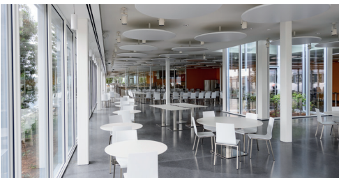
Tribunal de Paris Restaurant pour le personnel