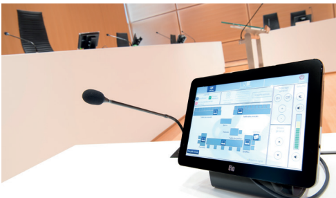
Tribunal de Paris Salles d'audiences - Technologie