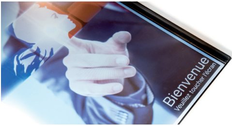
Tribunal de Paris Hall d'entrée - Salle des pas perdus - Écans d'accueil