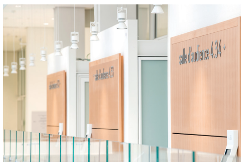
Tribunal de Paris Salles d'audiences